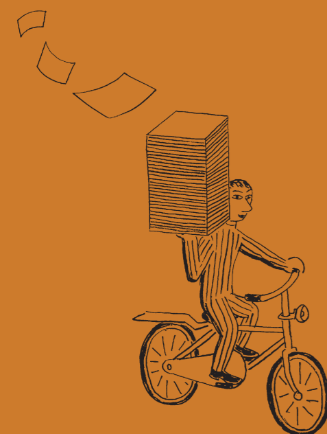
表紙 イラストレーション=下谷二助 デザイン=松吉太郎