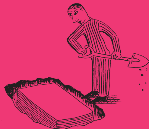
表紙 イラストレーション=下谷二助 デザイン=松吉太郎