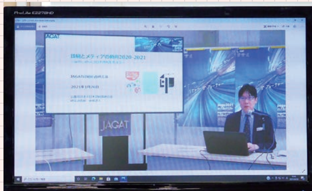
オンラインセミナーの配信イメージ パソコン・タブレットなどから視聴できます