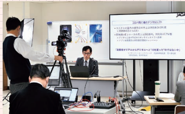
オンラインセミナーの収録風景 JAGAT 本社に専用スタジオを設置しています