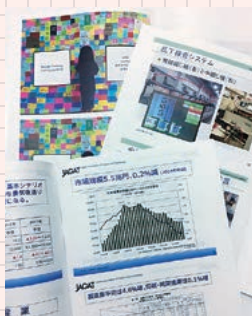
年間60部前後の研究会資料

2020年の実績『印刷界OUTLOOK 2019/2020』『テレワーク時代の印刷ビジネスモデル読本』『DM DIGEST BOOK 2020』（協力：日本郵便・日本ダイレクトメール協会）『2020日本の広告費』（協力：電通メディアイノベーションラボ）