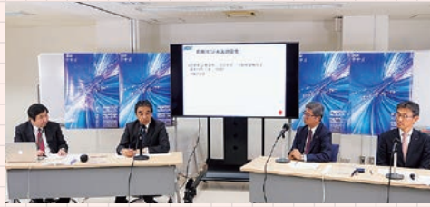
page2021はオンラインで開催

カンファレンスでは、注目の技術やビジネスモデルをテーマに議論します。毎年1000人以上が参加する一大イベントです。