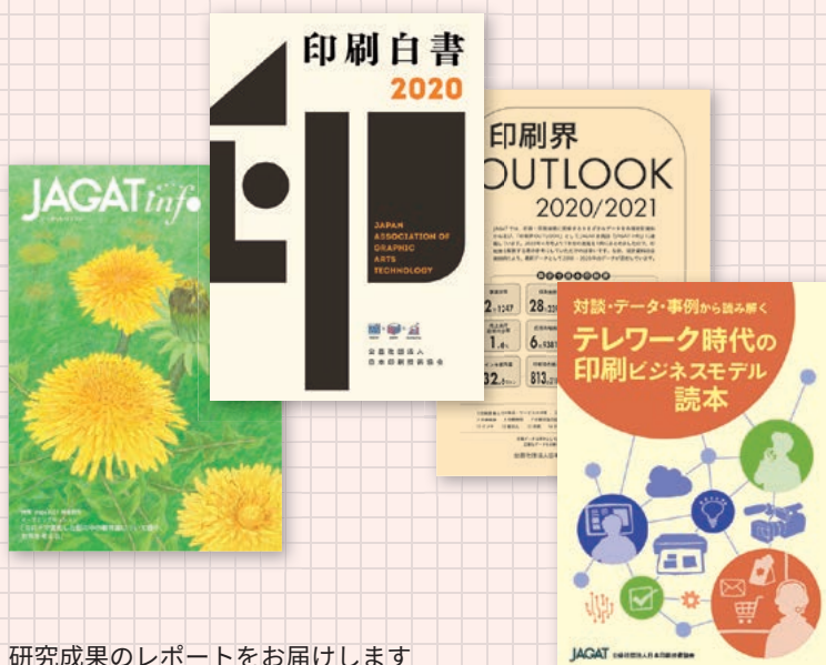
研究成果のレポートをお届けします