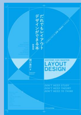
『だれでもレイアウトデザインができる本』