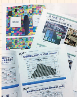
年間50部前後の研究会資料

特定分野の成果を提供します。 2022年度の実績 『印刷界OUTLOOK 2021/2022』 『DM DIGEST BOOK 2022』（協力：日本郵便・日本ダイレクトメール協会） 『2022日本の広告費』（協力：電通メディアイノベーションラボ）