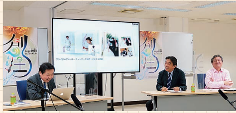
page2023はオンラインで開催

カンファレンスでは、注目の技術やビジネスモデルをテーマに議論します。毎年1000人以上が参加する一大イベントです。