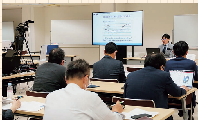
会場でのセミナー受講 JAGAT 本社に専用スタジオを設置しています

開催1週間後から1週間はいつでも視聴できるので、当日参加できなくても安心です。(本研究会メンバーであり、なおかつ当該回の参加申込みをした方が対象)