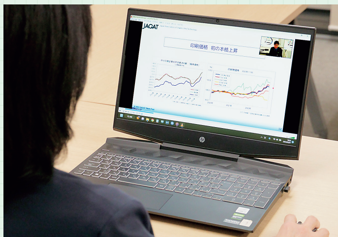
オンラインセミナーの配信イメージ パソコン・タブレットなどから視聴できます