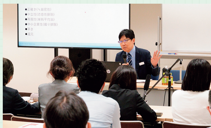
会場でのセミナー受講

開催1週間後から1週間はいつでも視聴できるので、当日参加できなくても安心です。(本研究会メンバーであり、なおかつ当該回の参加申込みをした方が対象)