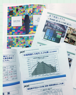
年間50部前後の研究会資料

月例研究会で各界第一人者の講師が用いた最新の講演資料が年12回届きます。年間約50名分を入手でき、『JAGAT info』と併せて読めば印刷ビジネスの最新情報をより早く深く理解できます。