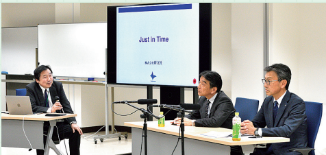
オンラインで実施したpage2024基調講演

pageはJAGATが主催する印刷・メディアビジネスの総合イベントで、例年2月に開催します。 カンファレンスでは、注目の技術やビジネスモデルをテーマに議論します。