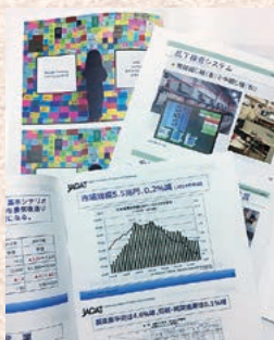
年間70部前後の研究会資料

特定分野の研究成果を書籍・冊子として提供します。これまでの実績例『印刷界 OUTLOOK』『デジタル印刷レポート』『DM DIGEST BOOK 2017』（協力：日本郵便・日本ダイレクトメール協会）『2017日本の広告費』（協力：電通総研）